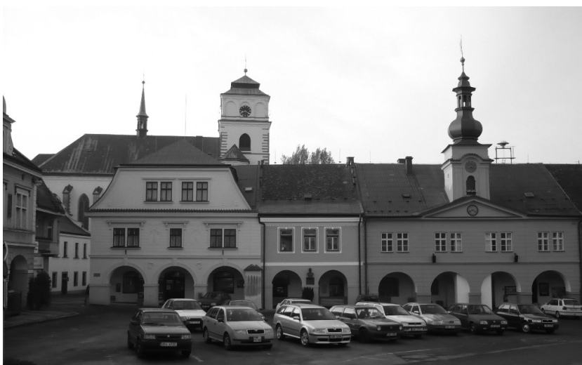
Šrámkův dům - sídlo SMKs a MIC (vlevo), Městská knihovna F. Šrámka (uprostřed) a bývalá radnice s Městským divadlem (vpravo).