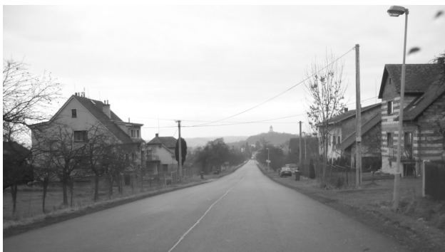
Pohled ze Staňkovy Lhoty do Sobotky.