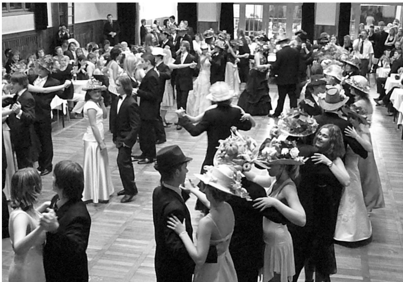
Přehlídka doma vyrobených klobouků se nesla ve znamení podzimu. (2. prodloužená lekce - 8. 11.)