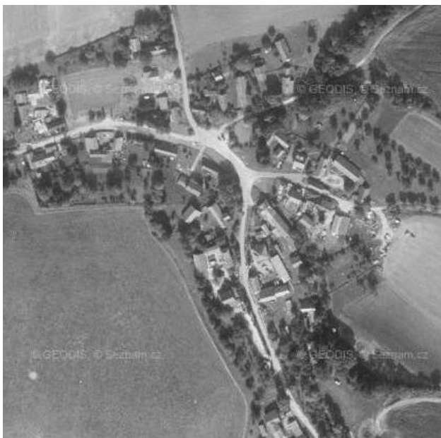
Letecký pohled na Spyšovou.