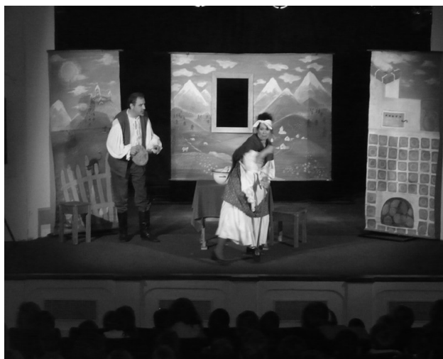
Divadlo DP z Prahy uvedlo v pondělí 19. května dopoledne pro děti z mateřské školy a 1. - 3. třídy základní školy pohádku JAK KRAKONOS PEKAŘKU JÍŘU NAPRAVIL .