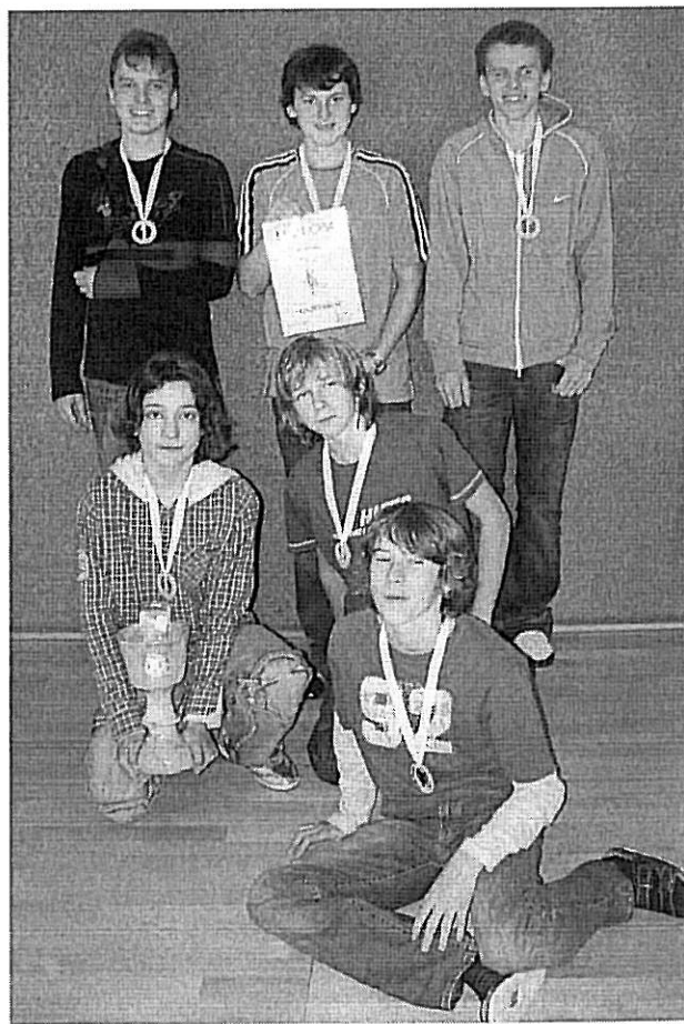
Vítězný tým CARPE DIEM z 9.A