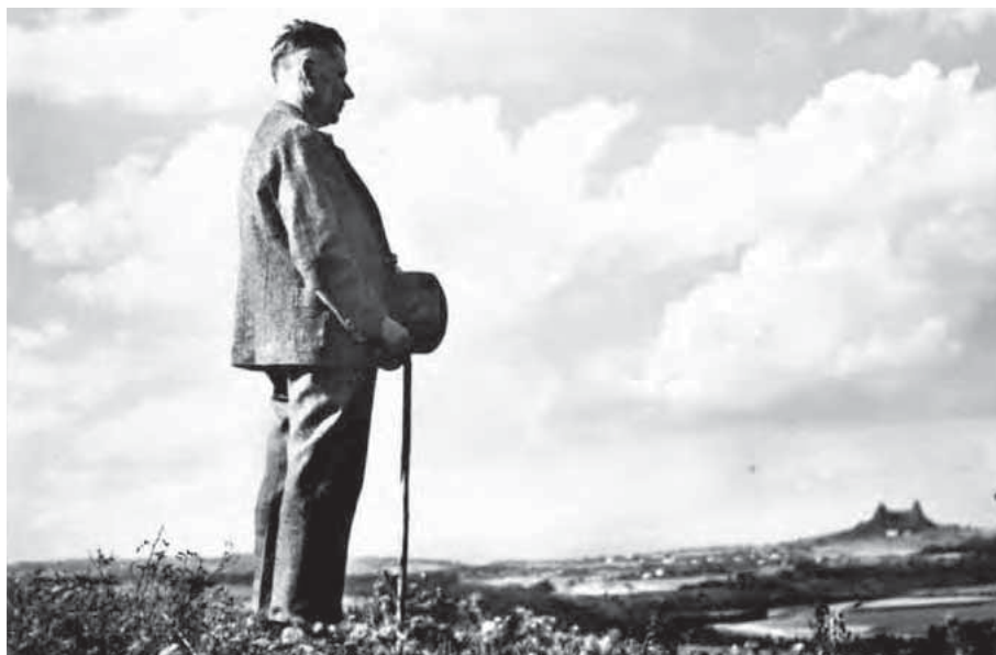
Fráňa Šrámek na procházce v rodném kraji

Milí čtenáři, v tomto čísle Zpravodaje bych ráda připomněla vztah Fráni Šrámka k Sobotce a k rodnému kraji.