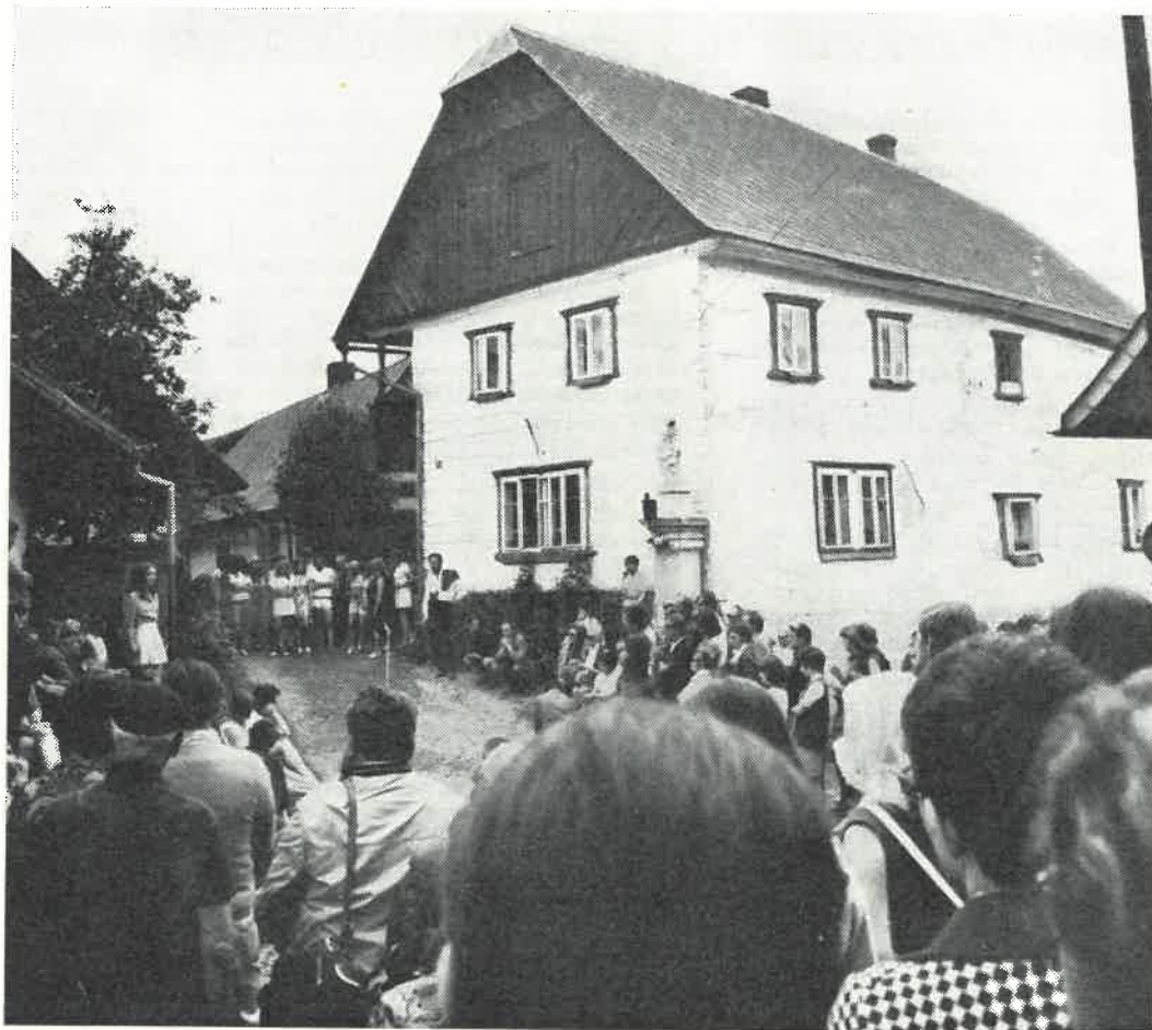
Poetické odpoledne na XVI. Šrámkově Sobotce — zastavení u sv. Anny