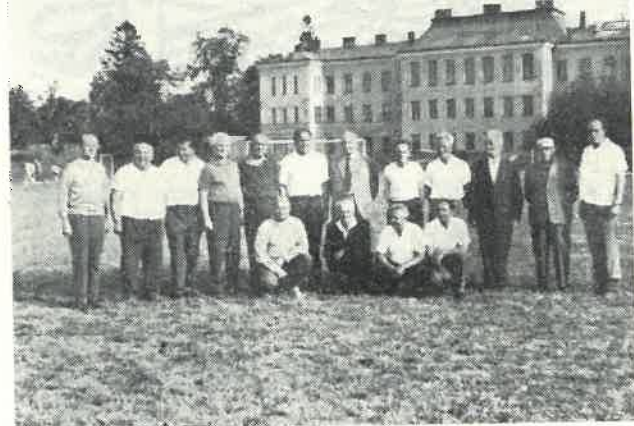
Z oslav 40 let sobotecké kopané. Setkání zakládajících členů a funkcionářů SK Sobotka.