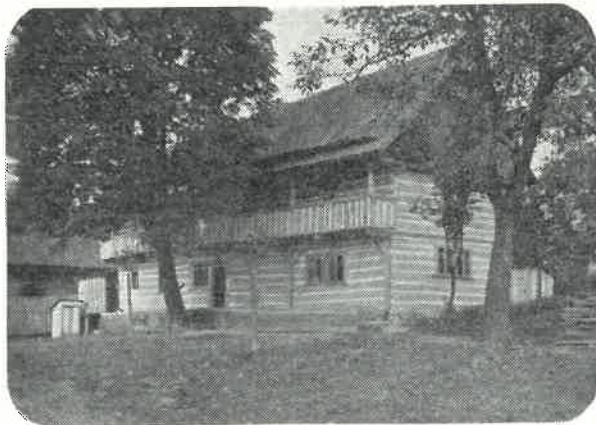
Rodný statek Václava Šolce v Sobotce