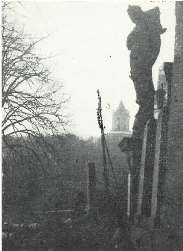
Ze soboteckého hřbitova

3. Smím, neptán, připojit ještě odstavec? Nedávno jsem psal fejeton o časopisech, které si vydávají města a kraje. Chvátil jsem ty, které se snaží o vybudování a posílení vlastní kulturní tradice. Vaše zasloužilá mi zavýčitala — a právem, že jsem na Zpravodaj Šrámkovy Sobotky zapomněl. Víím, že se tu obětavě a bez subvence dělá skvělá práce. Máte vděčný kraj; nejen přírodní krásou, nejen historií, ale také umělci, kteří s ním spojili své dílo — Šolc, Šrámek, Mánes a jiní. Sám jsem velmi ocenil řadu článků, když jsem studoval Mánesa. A pokud jde o Šrámka, jste, myslím, vzorem, jak kulturní tradici pěstovat, aby plodila radost Vám doma i všem, kdo kdy přijdou, aby se u Vás osvěžili láskou k umění. Pochopitelně, nešlo by to, kdyby právě Šrámek nebyl Šrámkem. Ale jemnost, cit, vkus, jak jste se té tradice chopili a jak ji zpřítomňujete, úroveň, na níž se Vám daří udržet jak časopis, tak sobotecká setkání, to je zcela mimořádné a jiná města by se měla u Vás učit. Jsem Vám za to vděčný a přeji Vám na té cestě mnoho zasloužené radosti.