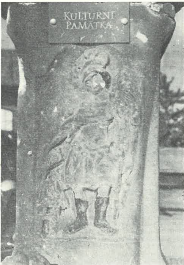
Detail z kalvárie u Příchvoje

A nakonec ještě dvě pojmenování částí obce: jedné straně Příchvoje se říká U kovářny , druhé Na Benátkách . Zina Folprechtová