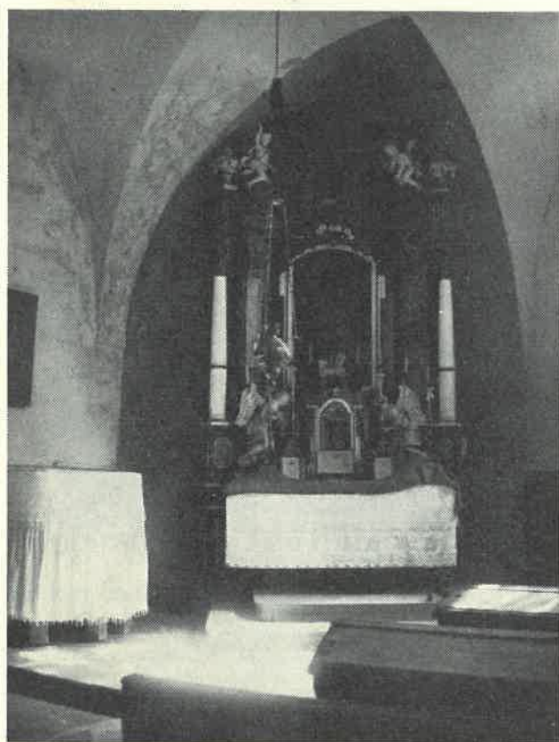
Interiér kaple na Kosti