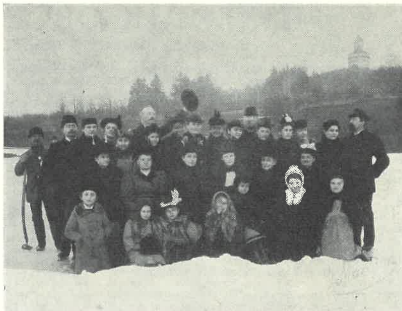
Společnost bruslařů pod Humprechtem před r. 1900

Narodil se 9. 8. 1874, zemřel 28. 4. 1945. K fotografování se dostal nejspíše během svých pražských studií (1895 až 1897), v Sobotce patřil ke skupině průkopníků amatérské fotografie. Podle obrázků zachovaných v soboteckém archivu měl aparát 9 × 12 cm s velmi dobrou optikou. Při tak velkých negativech nebylo zvětšování nutné a tak známe většinu jeho snímků z kontaktních otisků. Přesto se ale úspěšně pokusil i o zvětšování. Jaroslav Macoun měl značný smysl pro výtvarné hodnoty a pochopení pro dokumentační fotografii. Hlavním objektem jeho fotografického zájmu byly architektonické památky. Pochopil už tenkrát, jaký význam mají dřevěné sobotecké domy, ale cenil si i tehdy opomíjených staveb empirových. Díky jeho práci se nám zachovaly snímky četných objektů, které buď během času zmizely nebo byly nejrůznějšími způsoby adaptovány. Podívejme se jen na připojený snímek