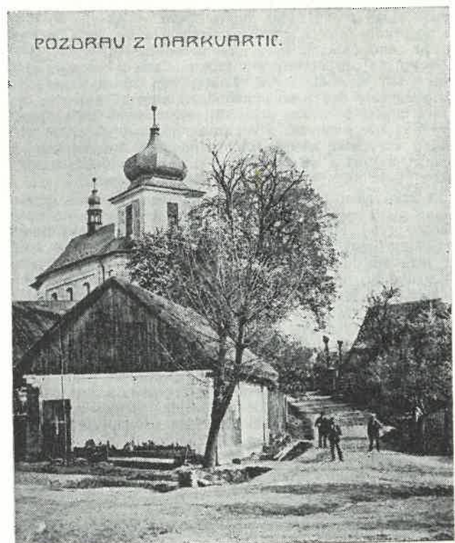
Starý pohled na Markvartice. Pohlednice z přelomu století.

zpíval: Mein lieber Augustin! I ptám se jej, jestli by učitele potřeboval. Ale on té chvíle potřeboval všechno a pravil: Jdou se mnou do domu mého, já mám dva chlapce a ty mně budou učit, já jim dám stravu a obydlí od učení. I jdu s ním do příbytku jeho, ptám se manželky jeho, zdaliž by tomu tak bylo, jak mně pán připověděl, ale ona mně řekla, když to pán připověděl, já jsem svolující. Za čtrnáct dní se sem přistěhuju, pravím mezi jiným rozmlouváním, a jdu zase zpátky do vlasti své k rodičům svým. Na cestě dosti jsem sobě představoval, vždyť ten člověk byl opilý, nebude držet slova svého, ale posleďně sem jen tím byl spokojený, když budu mít ke