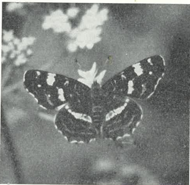
Babočka sítkovaná Araschnia levana L. Motýl byl chycen v Pláckánku 2. srpna 1970.

● Jičínskou padesátku — V. ročník dálkového orientačního pochodu Českým rájem, pořádal 28. března oddíl orientačního běhu TJ Jičín. Trasa vedla z Jičína přes Nebákov, Kost, Hrubou Skálu a Prachovské skály zpět do Jičína.