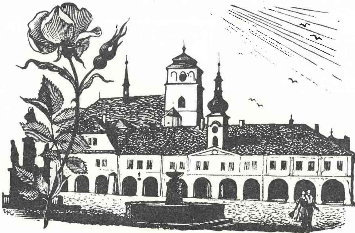
Akad. malíř Vladimír Kopecký: Sobotecké náměstí