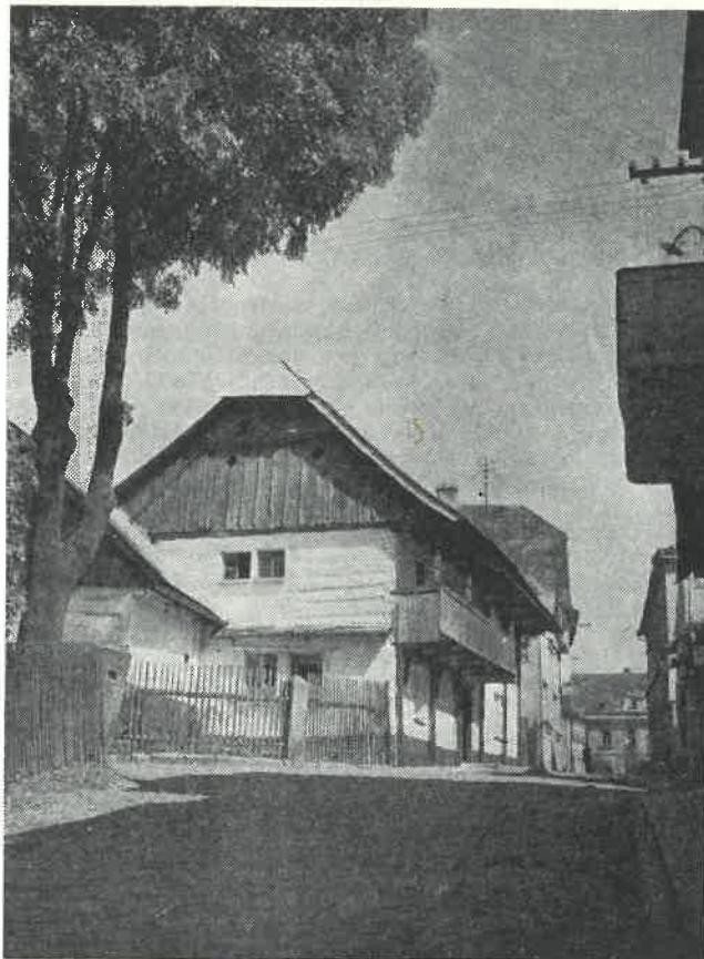
Vránův dům v Sobotce, odkud vyjížděl formanský vůz