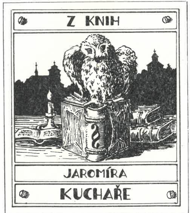
Exlibris Jaromíra Kuchaře od Josefa Fejžara