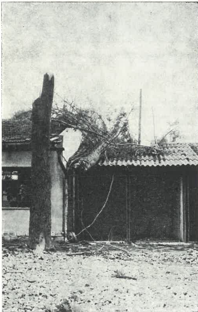
Mladějov 11. srpna 1971