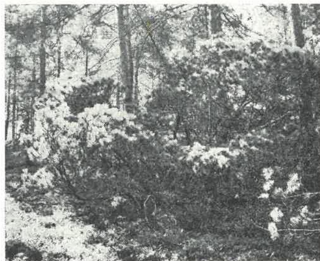
Porost kosodřeviny u Pomníků za Kostí.