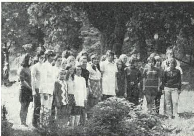
Z poetického odpoledne XV. Šrámkovy Sobotky

Holana, Biebla, Hrubína a další, dala jí velkou prozaickou generaci, z níž bychom tady jako blízence Jarmily Glazarové připomněli zejména autory, kteří tolik vykonali pro pozdvížení českého spisovného jazyka: Karla Čapka, Vladislava Vančuru, Ivana Olbrachta. Období mezi dvěma válkami je obdobím, které dalo české literatuře nejšťastnější podmínky. Je to doba, kdy česká literatura nemusí již, jako například tomu bylo v devatenáctém století, suplovat řadu jiných funkcí společenských, kdy může být víc sama sebou, víc se soustředit do sebe, a to se také obráží v její podobě.