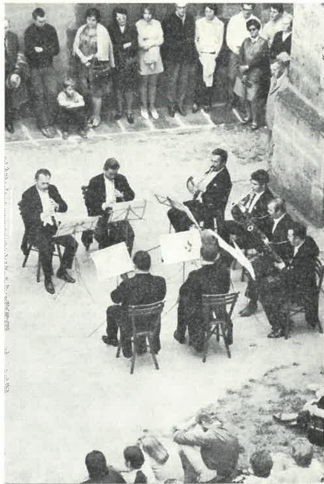
Collegium musicum pragense na Kostí 4. VII. 1971

V osecké kronice Macounových je zmínka o tom, jak vypadal jejich dvůr, když se opět vrátili domů. Všude bylo rozházené seno, Prusové ukradli dříví, všechna drůbež zmizela. Nastal prý takový hlad, že lidé chodili až do Libošovic na hrách, dodává trochu nadsazeně autor.