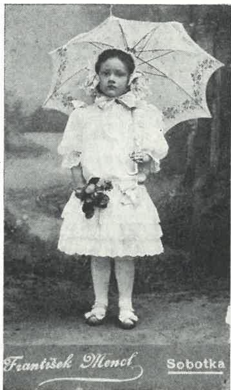
František Mencl: Dívka se slunečníkem