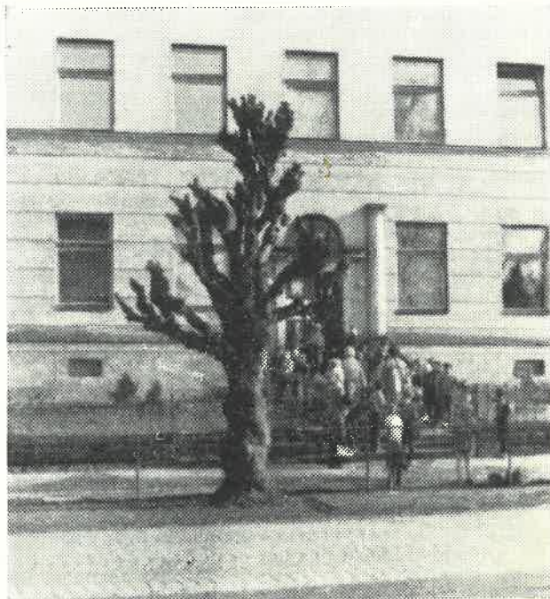
„Samorost“ před školou

To už mám před sebou fotografii z divadelního představení „Jiříkova vidění“ od Josefa Kajetána Tyla (otič-