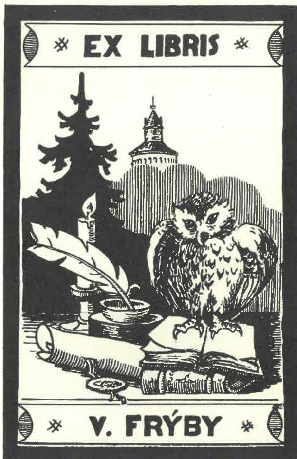
Exlibris Václava Frýby od Josefa Fejbara

Kde a komu hrávali? Kdekomu a při nejrůznějších příležitostech. Na veřejných oslavách státních svátků a památných dnů i na školních oslavách těchto výročí a shromážděních žákovské organizace. Pracujícím na závodech, rekreatantům v lázních a zotavovnách. Družstevníkům před zahájením žnových prací i při dožínkách. Na letních slavnostech, při hovorech s občany a na kon-