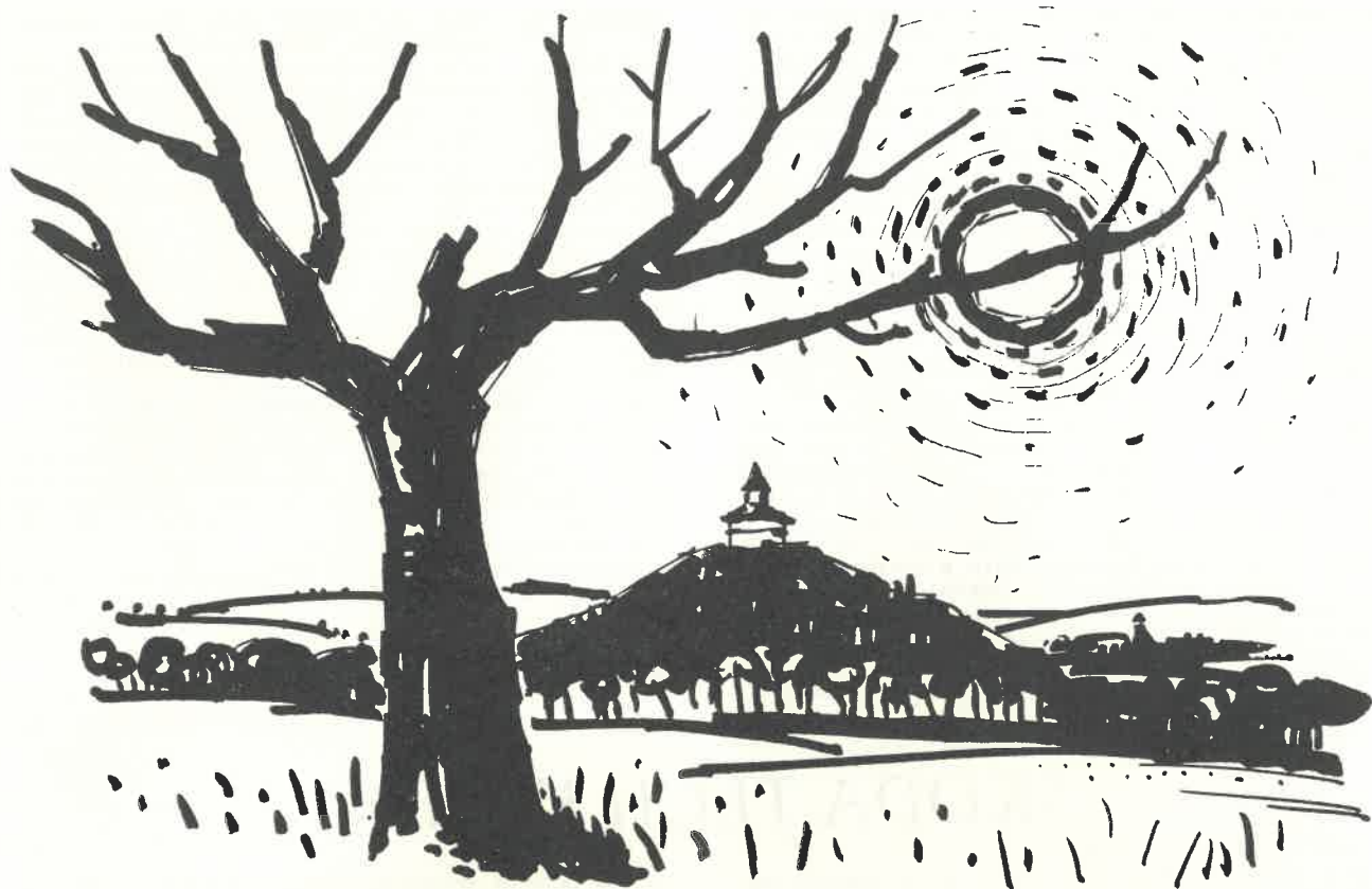
Jaroslav Šámal: Pohled na Humprecht