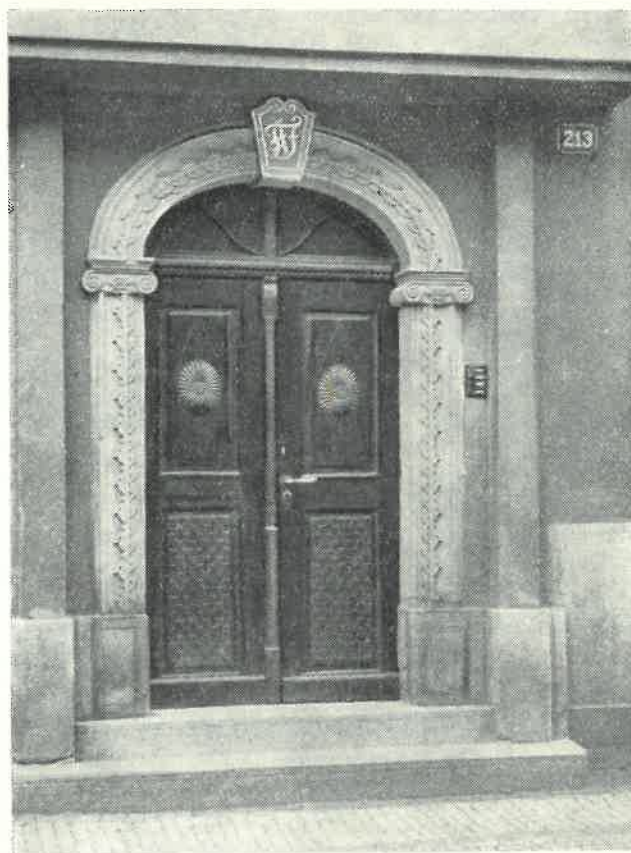
Soutěžní úkol č. 2. Do 30. března napište na adresu redakce, co je na fotografii zobrazeno. Na první soutěžní úkol nám došlo mnoho odpovědí, zvláště od žáků ZŠ v Sobotce. Výsledky prvního kola otiskneme v příštím čísle.