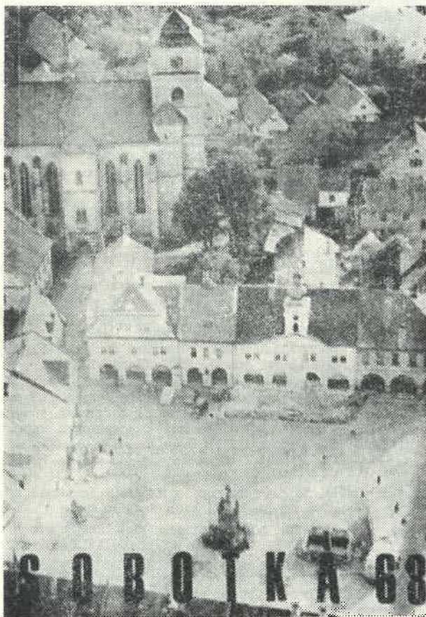
Obálka sborníku Sobotka 1968