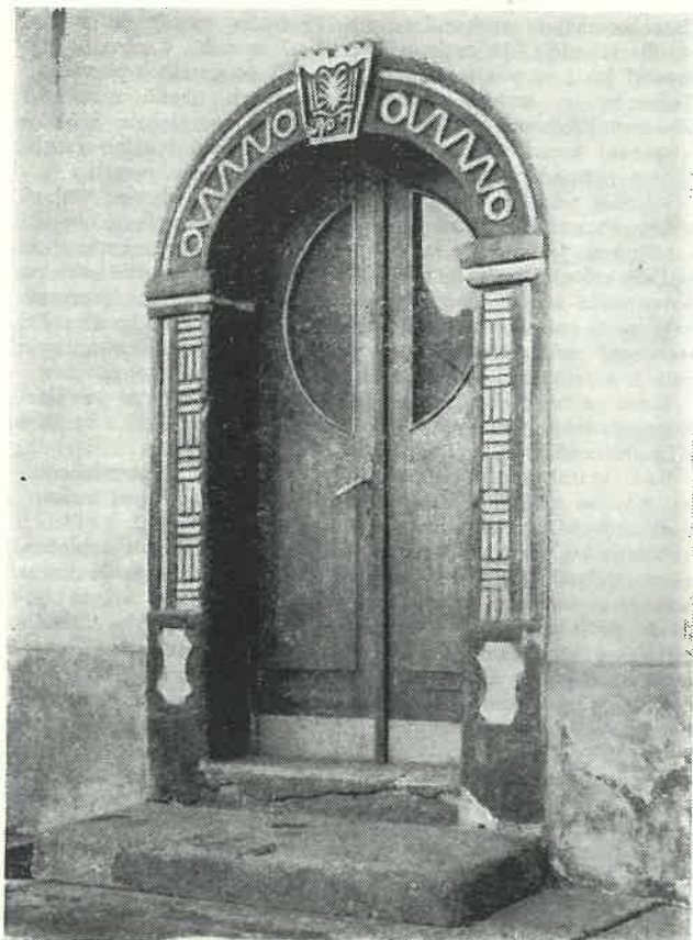
Empirový portálek u Brixova statku č. 188 v Sobotce.

až končí pouhými letopočty a monogramy. V 19. století však ještě vznikají nápisy zcela obdobné malovaným textům na záklopách. Uvádím několik příkladů.