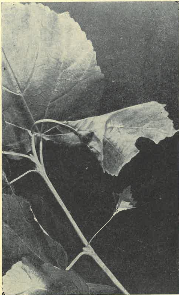
Kápovité listy z humprechtských lip. Archiv „Beseda“.

Na počátku byla legenda. Když r. 1420 v šumavských předhořích se otvíralo jaro (10. května), přepadli husité