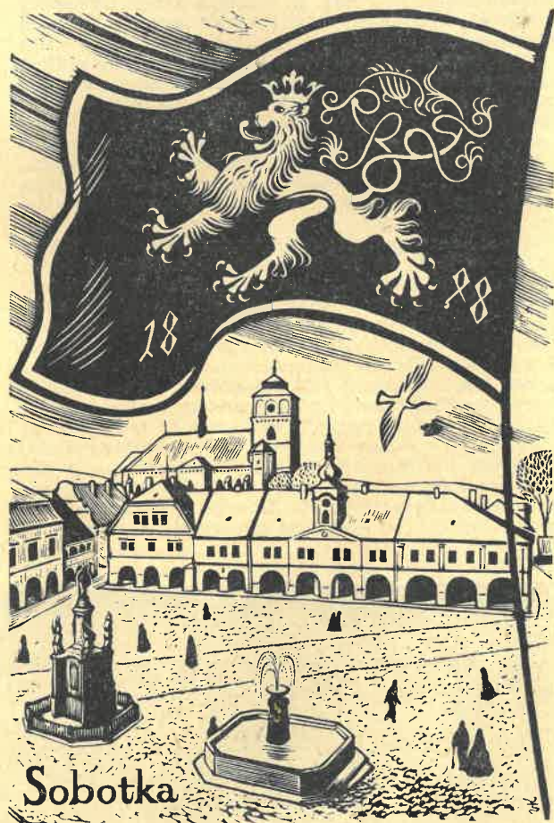
27. října až 17. listopadu se uskuteční v čítárně Střediskové knihovny v Sobotce výstava díla akad. malíře Vladimíra Kopeckého. Na vernisáži účinkuje Recitační studio Srámkova domu. Přinášíme reprodukcii jedné z posledních prací mladého umělce.