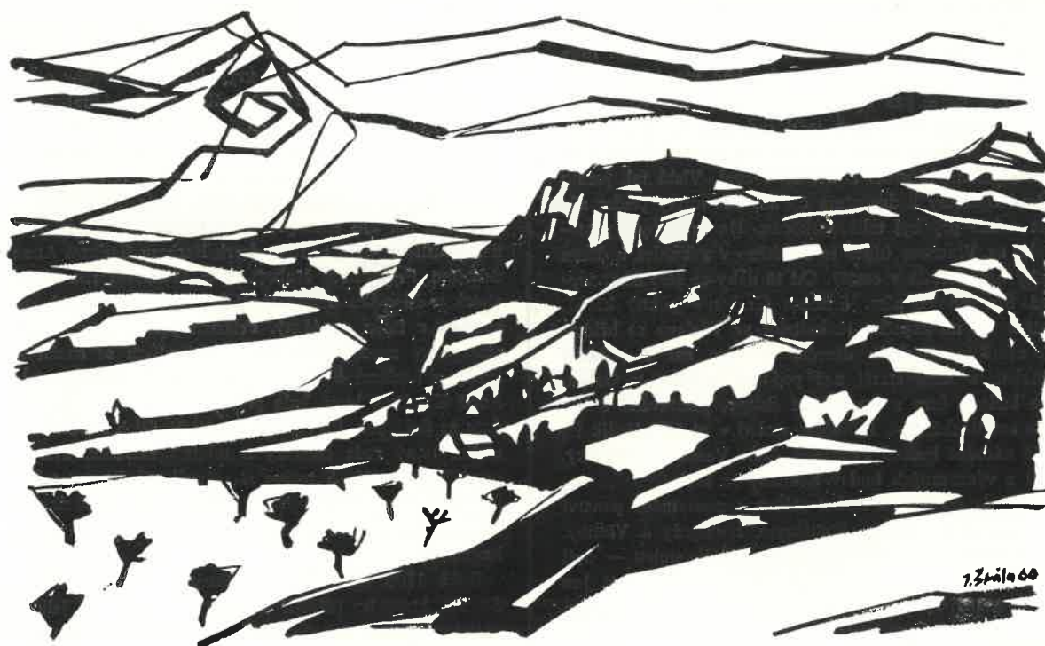
Akad. malíř Jan Špála: Vrch Mužský (kresba tuší).