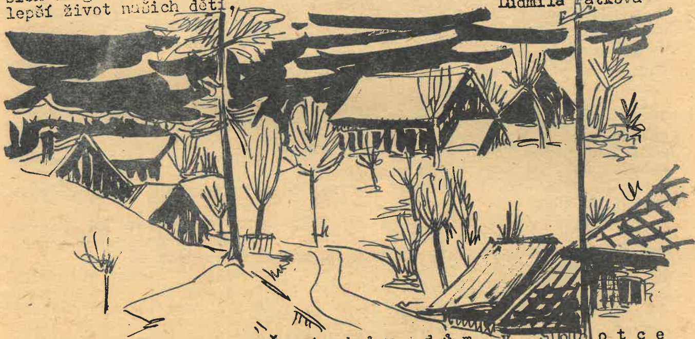
Š r á m k ů v d ů m v S o b o t k e